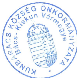
Hegedűs Lászlóné polgármester